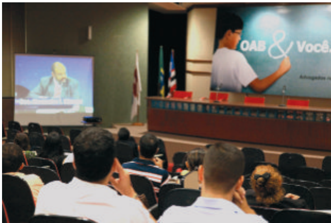
Aulas dos cursos são exibidas na sede da OAB/MA, com expositores de renome nacional

do Trabalho está sendo gratuito para os novos advogados