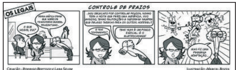
CARTUM GENTILMENTE CEDIDO POR SELEM, BERTOZZI CONSULTORES ASSOCIADOS

Uma pesquisa realizada pela Fundação Getúlio Vargas (FGV) junto aos bacharéis em Direito que realizaram a primeira fase do último Exame de Ordem traz revelações que refutam argumentos dos que são contrários à exigência. 83% dos entrevistados consideram o Exame importante ou muito importante para manter o bom nível da Advocacia. Os favoráveis à realização do Exame correspondem a 82%, enquanto 86% preferem o modelo unificado em todo o país, como o que vem sendo adotado. Sua utilidade é reconhecida por 75% dos bacharéis.