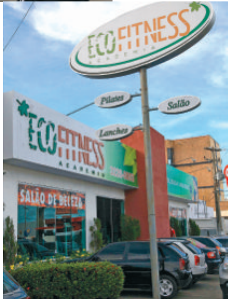
Academia Ecofitness na avenida Daniel de La Touche

Todas as modalidades são oferecidas através de planos especiais como: Plano executivo (em horário especial), Plano Familiar, Plano Teen (direcionado para adolescente de até 16 anos), Plano Colegial (convênios com escolas), Plano Empresarial (destinado a servidores e dependentes de empresas conveniadas), Pla-